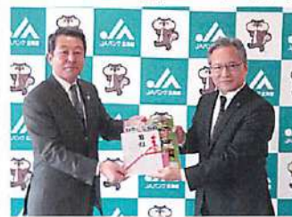
北海道教育委員会教育長へ贈呈

なお、本会からは北海道教育委員会へ教材本の贈呈を行い、教材活用への協力をお願いしました。