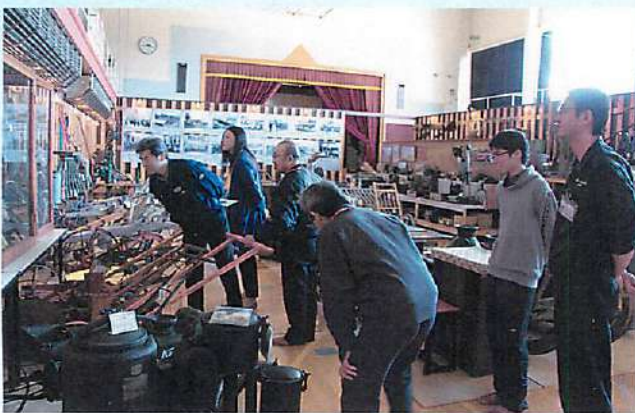
開拓時代の話を興味深く聞くセミナー生

始業式終了後、小清水町郷土資料館に会場を移し早速講義がスタート。農業技術の肥培管理と小清水農業の歴史について講義を受