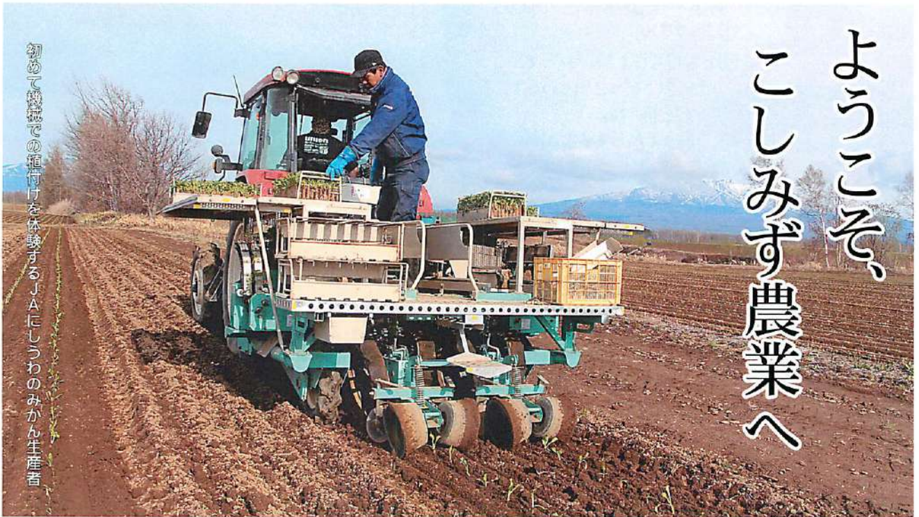
初めて機械での稲刈りを体験するJAにしゅうわのみかん生産者