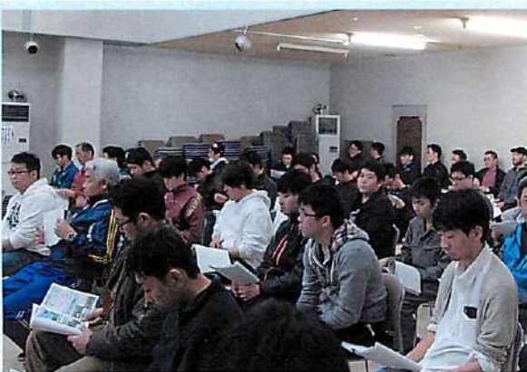
集中して講義を聞く参加者