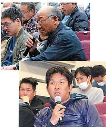
これからの小清水農業に関して活発な意見が飛び交いました