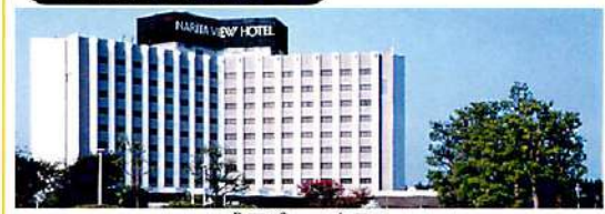
*** 成田ビューホテル ***

豊かな自然に囲まれたエアポートリゾート成田のホテル ■利用予定航空会社 : 日本航空 ■利用予定貸切バス会社 : なの花交通バス