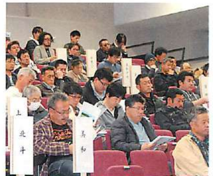
議事について真剣に考える総代

昨年を振り返りました。次に国際貿易交渉について、「日EU・EPAは、農林水産品ではTPPと同水準の82%の品目が関税撤廃されたことや、TPPは離脱したアメリカを除く加盟国11カ国で大筋合意され31年度の発効を目指していることから、引き続き対応を図っていく」としました。 最後に「第10次中期3カ年計画は過去の流れを引き継ぎながら、将来の小清水農業のあるべき姿を提示させて頂いた。農業は国民生活には欠かすことのできない大切な役割を担っている。先人から受け継いだこの素晴らしい大地に甘んずる事なく、気候変動等にも対応できる基盤を作り上げ、国民に安全で安心な農畜産物を責任をもって供給しなければなりません。」と述べました。