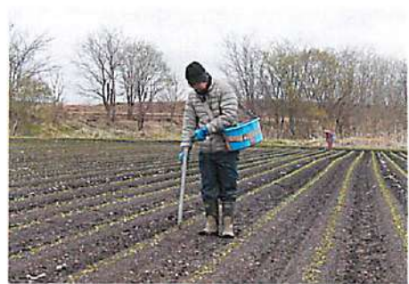
この日の気温は4度。北海道の春の厳しさを体感しました