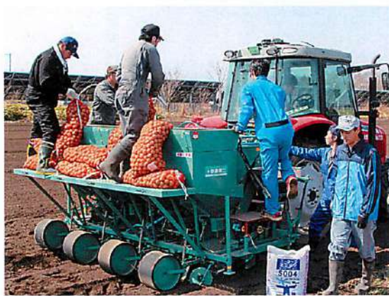
(下) 手際よく準備する青年部員。