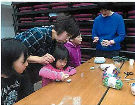
目的別グループ体験会では未来の女性部員も参加！？

ループがブースを開き、絵手紙やブローチ制作など、それぞれの活動を疑似体験しました。参加者からは「各グループがどんな活動をしているのか知らなかったもので、とてもいい機会になった」との声を聞くことができました。 その他にもフリーマーケットを開催しているブースもあり、手作り雑貨やルバーブジャムなどが多くの注目を集めました。 昼食では昔語りの会が毎年大好評の「すいとん」を振る舞い、その美味しさとポリウムに会場全員のお腹が満たされました。 当日はお子さんが春休みだったこともあり、子供連れで参加する人が多く、女性部員らは自分の子や孫のように子供たちとふれあい、会場は和やかな空気に包まれていました。