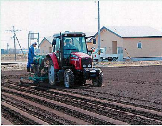
(上) 今年もどこよりも早くて美味しい小清水産新じゃがをお届けします。