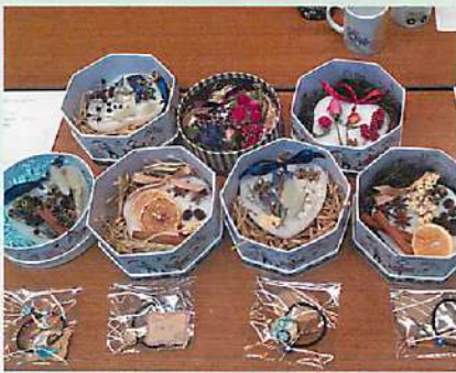
アロマとお花を使った作品もありました！

会場内に展示された作品たちは今年も目を引くものばかり！手芸部門では可愛い小物や便利グッズ、習字、カレンダーなどが並び、食品部門には、四季を彩ったお寿司や、お茶、コロッケ、おはぎ、ティラミスなどあらゆるご家庭の味が披露され、参加した方々の目を惹きましました。また、同時に会場内で行われた目的別グループ体験会も大盛況。各グ