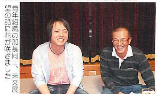
青年組織の部長同士、未来展望の話に花が咲きました