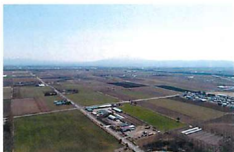
ドローンを使った撮影練習。畑には少しづつ作物が植えられ、春を感じられました。

組合員さんの身近にも、春から進学・就職など、新しい環境 で過ごされる方が多いのではないのでしょうか。かく言う私も 4月から企画情報係に配属され、何事も新しい出来事ばかり。 あっという間に2か月が経とうとしています。