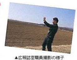
▲広報誌室職員撮影の様子

5月号より広報誌の作成を総務課広報室で担当することになりました。小清水の農業とJAこしみずについてお伝えすべく、広報誌のみならずHP、公式インスタグラム、x (旧Twitter)等を活用した定期的な情報発信を試みているところです。今回の広報誌作成のため、撮影や写真の提供にご協力いただいた多くの皆様に大変感謝申し上げます。今後は今まで以上に写真撮影をお願いする機会が増えてくるかと思いますが、ご協力いただけますと幸いです。今後とも、よろしくお願ひいたします。