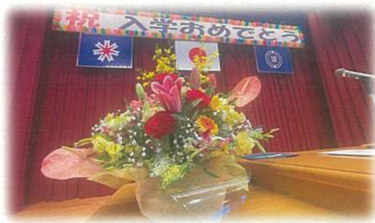
▲小清水小学校に贈ったお花