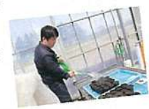
▲青年部園場用のかぼちゃの種を植えました。