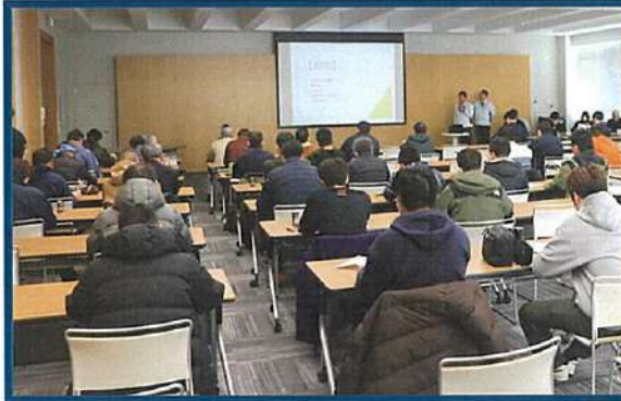
ホクレン中斜里製糖工場