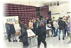
生活工夫展の様子