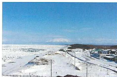
▲浜小清水の道の駅と広がる流氷

春は新たな始まりの季節です。本年はどのような1年になるのでしょうか。本年も豊作の年となるよう、小清水町全体が一丸となって1年頑張っていきましょう！