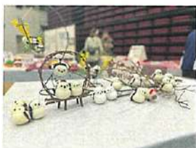
☆JA賞☆ お茶とお菓子と昔語りの会 「シマエナガのあみぐるみ」