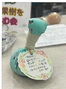
☆団体賞☆ ハーブと果樹を楽しむ会 「ハーブボール」