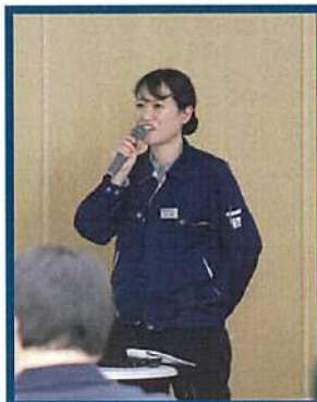
普及センター清里支所