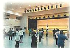
楽しくエクササイズ!