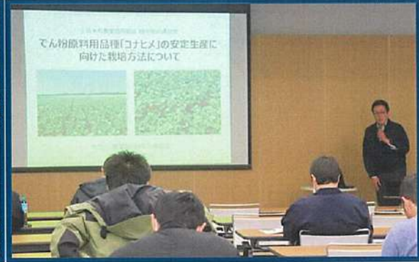
ホクレン農業総合研究所