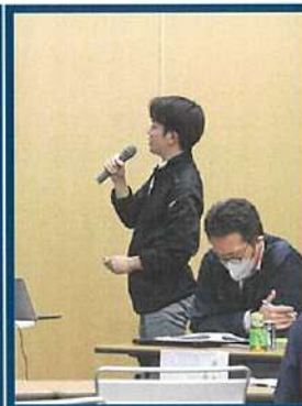
シンジェンタジャパン株式会社